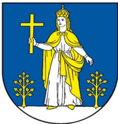
erb obce Čičmany

Symboly Obce Čičmany určené Štatútom Obce Čičmany (erb, vlajka)